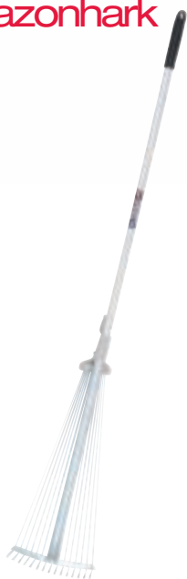
3882NB Metalen instelbare gazonhark