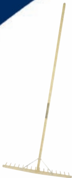
8207WH hark van hout