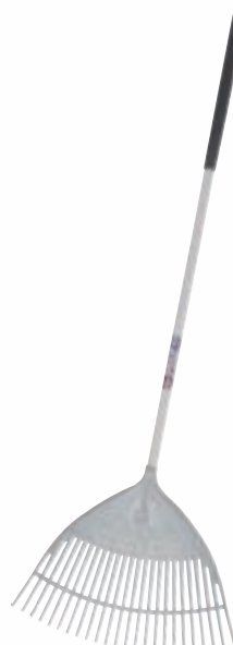
3884NB kunststof bladhark