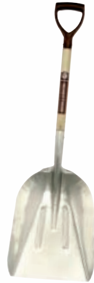
2750AG aluminium graanschop