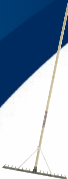
8206AH hark van aluminium