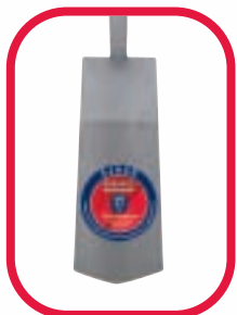
Gesmeed en deels gepolijst