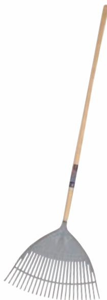
3884WNB kunststof bladhark