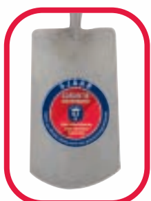
Gesmeed en gepolijst