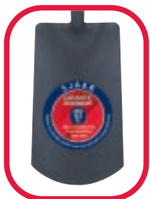
Gesmeed en voorzien van een epoxylaag

Omdat graven zwaar werk is, is sterk gereedschap een must. Daarom gebruikt Spear & Jackson alleen het beste staal dat kan worden gesmeed, gehard en gerold. Die sterkte, gecombineerd met de lange, sterke, weersbestendige houten stelen, maakt Spear & Jackson spades niet alleen zeer duurzaam, maar ook zeer prettig in het gebruik.